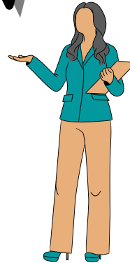
Okul Psikolojik Danışmanı

Devamsızlık, öğrencinin velisinin bilgisi dışında veya izinsiz, sevksiz, raporsuz okula gelmemesi durumudur.